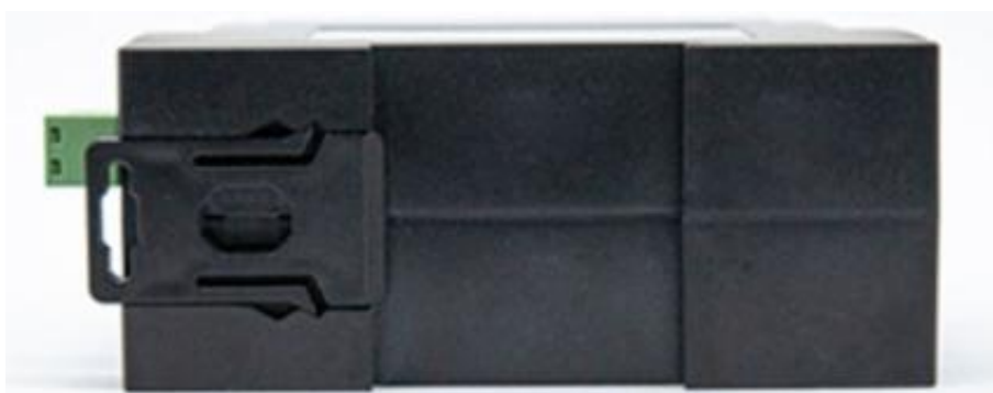
图 6 设备背部图

安装方法：设备外壳带有 35mm 标准导轨卡扣，有导轨的场合，可直接将设备装至导轨中。