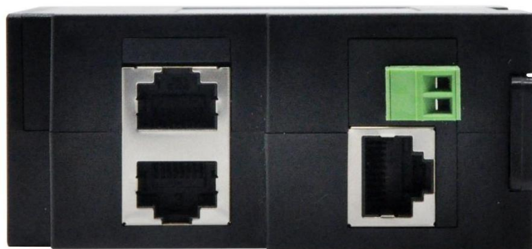
图 5 9850M 底部图

安装方法：设备外壳带有 35mm 标准导轨卡扣，有导轨的场合，可直接将设备装至导轨中。