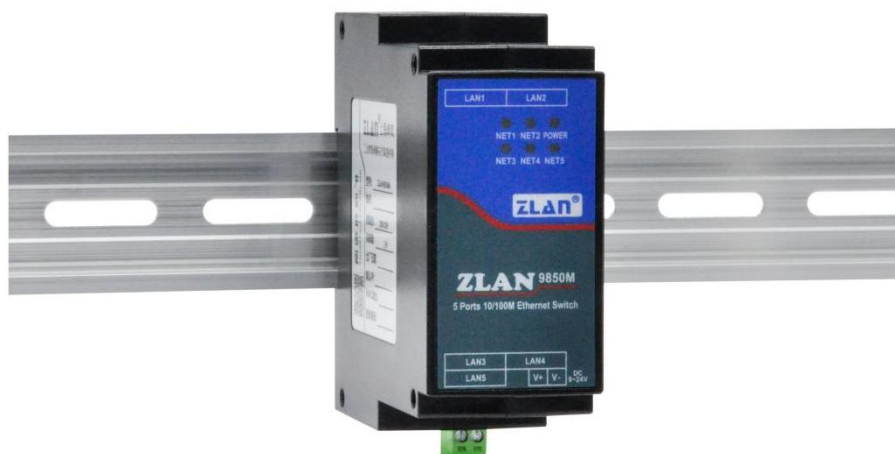
图 1 ZLAN9850M

设备无需配置即插即用，可以自适应不同的网络环境，保证稳定可靠的网络连接。同时，它还具有高速传输的特点，能够满足用户在网络使用中的各种需求。