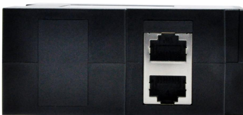
图 4 9850M 顶部图

9850M 底部，带有 3 个 RJ45 口以及供电端子，分别为 LAN3~LAN5,V+,V-: