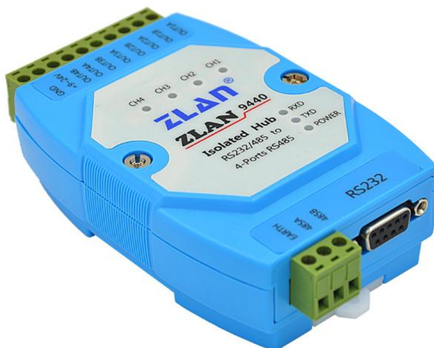
图 1 ZLAN9440 外观

如果只需要一路有源隔离型 RS232 转 RS485 则型号是 ZLAN9410。